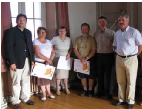
Remise des prix le 2 juin