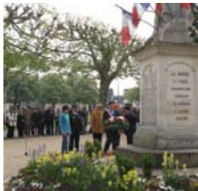
8 mai Victoire de 1945

Les cérémonies commémoratives mobilisent toujours un grand nombre de personnes, qui, toutes générations confondues, participent au devoir de mémoire.