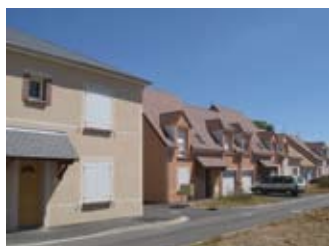
rue des Lavoirs : 12 pavillons