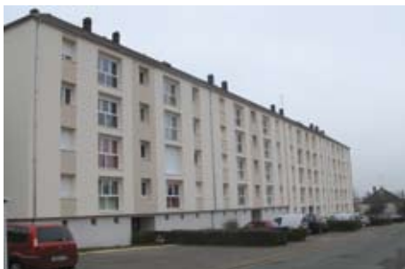
rue Henri Dunant : 36 logements