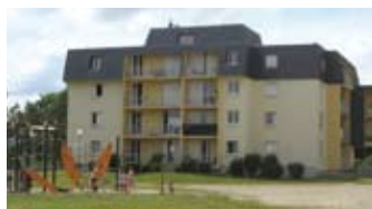
rue des Noyers : 65 logements