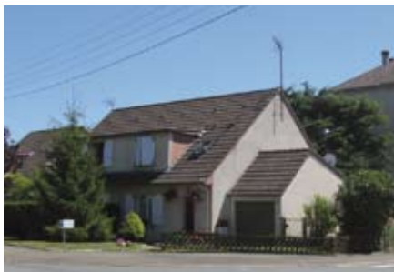
rue de Robinson : 4 pavillons