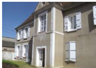
rue St Romain : 4 logements