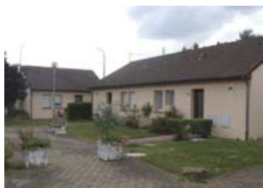
square de Querrieu : 11 pavillons