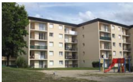
avenue Pont-Mousson : 66 logements rue du Docteur Rabourdin : 44 logements