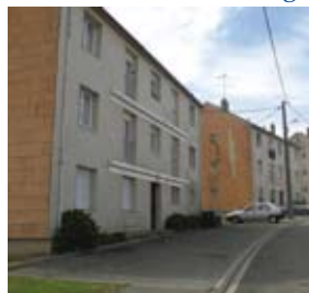
rue Thiers : 10 logements