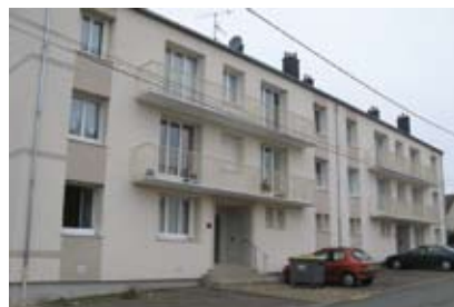
7 et 9 rue Thiers : 10 logements