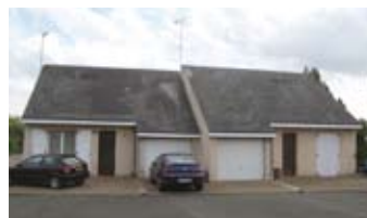
22 avenue Galliéni : 3 pavillons