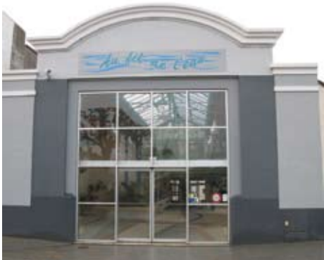
Entrée du Passage Au Fil de l'eau, rue de l'Hôtel de Ville