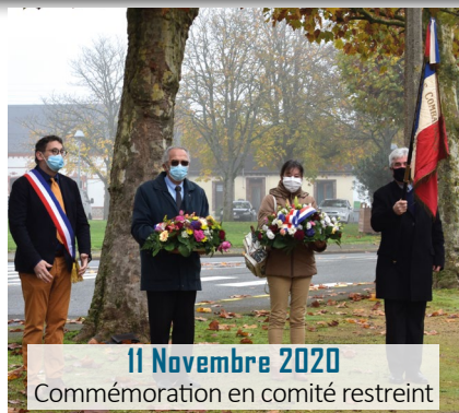
11 Novembre 2020 Commemoration en comité restreint