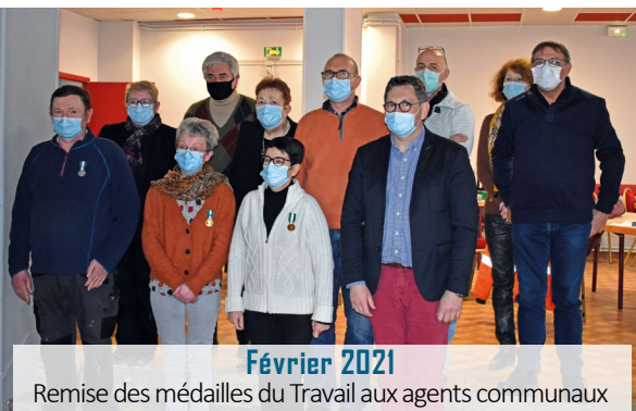
Février 2021 Remise des médailles du Travail aux agents communaux