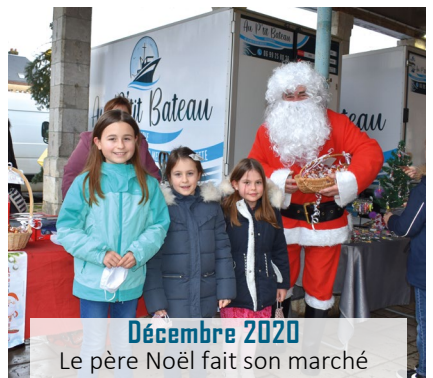
Décembre 2020 Le père Noël fait son marché