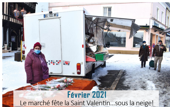
Février 2021 Le marché fête la Saint Valentin...sous la neige!