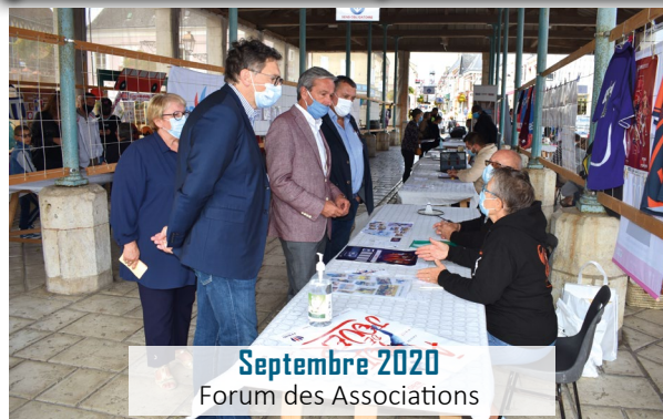
Septembre 2020 Forum des Associations

Si vous êtes une association, que vous souhaitez diffuser une affiche ou un message sur le panneau lumineux, alors contactez le service communication : 02.37.47.07.81 - communication@brou28.com