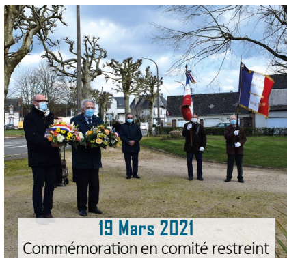
19 Mars 2021 Commemoration en comité restreint