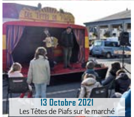
13 Octobre 2021 Les Têtes de Piafs sur le marché