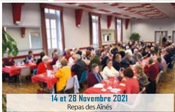
14 et 28 Novembre 2021 Repas des Aînés