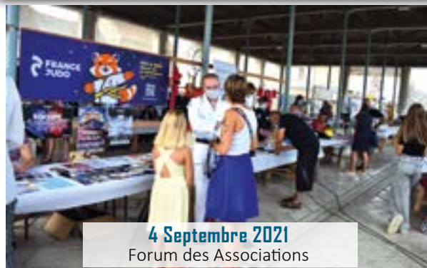
4 Septembre 2021 Forum des Associations