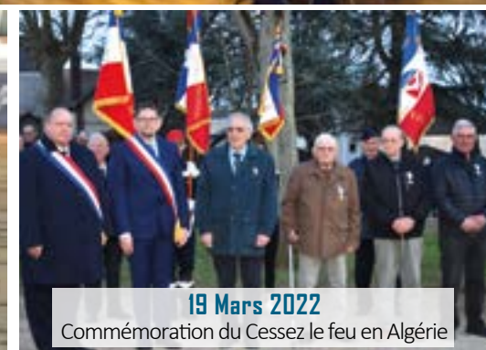
19 Mars 2022 Commémoration du Cessez le feu en Algérie