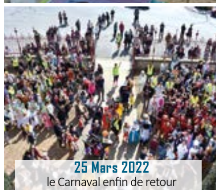
25 Mars 2022 le Carnaval enfin de retour