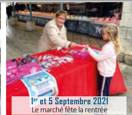
1 er et 5 Septembre 2021 Le marché fête la rentrée