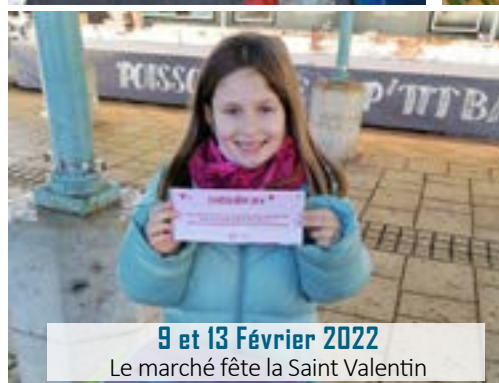
9 et 13 Février 2022 Le marché fête la Saint Valentin