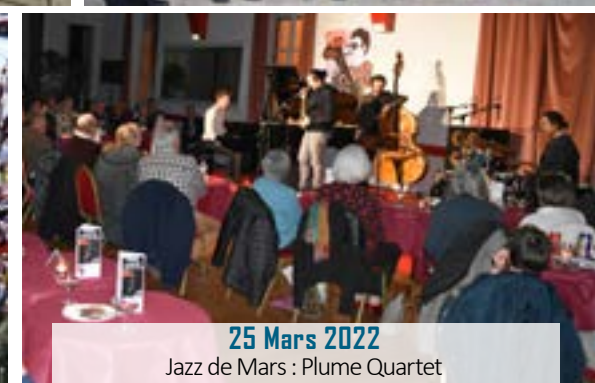
25 Mars 2022 Jazz de Mars : Plume Quartet