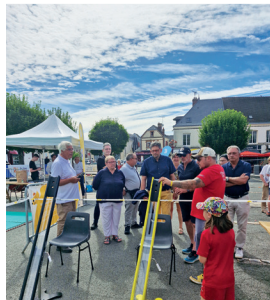
5 juillet 2025 Les Jeux sportifs