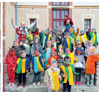
28 mars 2025 Carnaval des écoles