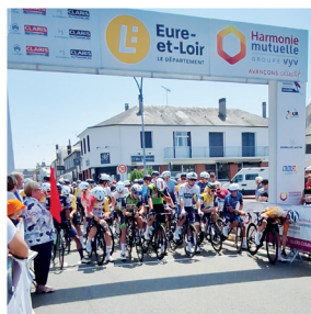
13 juin 2025 Départ du Tour d'Eure-et-Loir