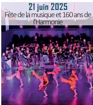
21 juin 2025 Fête de la musique et 160 ans de l'Harmonie