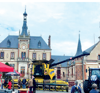
24 mai 2025 Plus belle la campagne