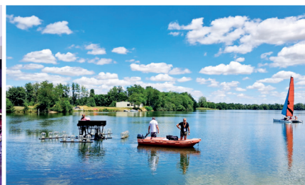
29 juin 2025 1 er Festival de l'Eau avec le Grand Châteaudun Tourisme