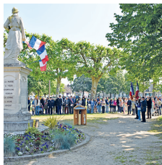
8 mai 2025 Commémoration du 8 mai 1945