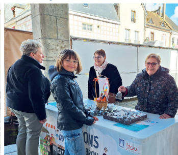
16 avril 2025 Le marché Fête Pâques