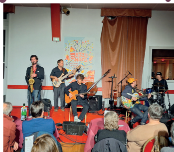
21 mars 2025 Jazz de mars : Quai de la Seine