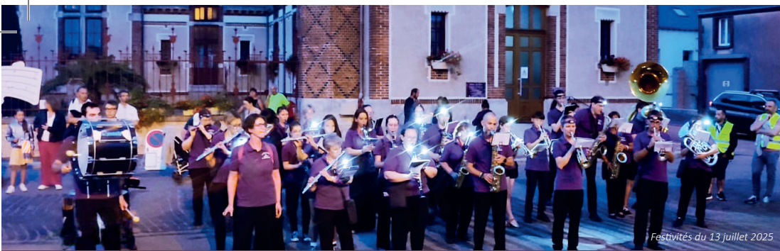
Festivités du 13 juillet 2025