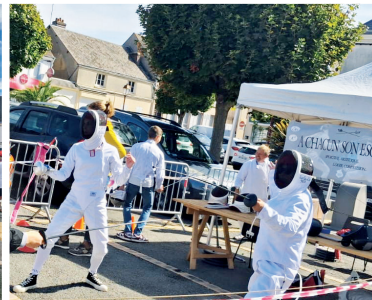
6 septembre 2025 Forum des Associations