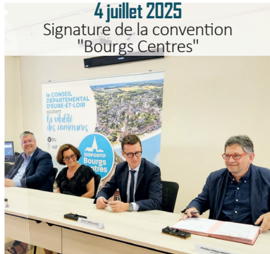
4 juillet 2025 Signature de la convention "Bourgs Centres"